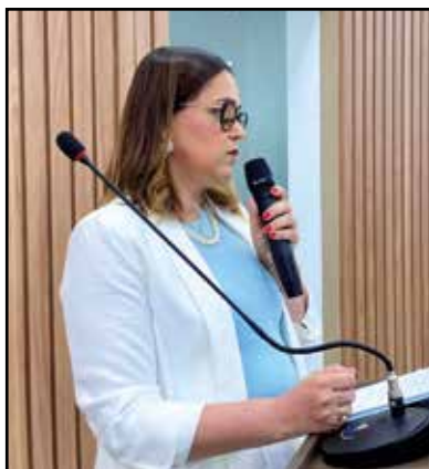
IMAGEM: reprodução do arquivo da Coordenação de Direito – Cerimônia da Beca 2024.2.