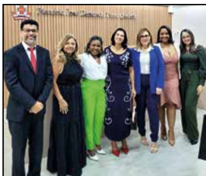
Cerimônia da Beca 2023.2.