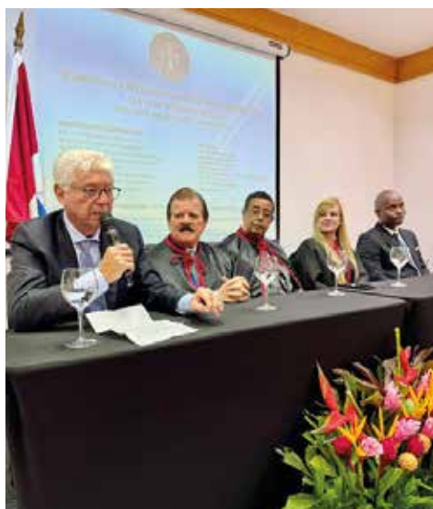
III Simpósio de Direito e Ética , realizado nos dias 12 e 13 de setembro de 2025, na cidade de Maceió-AL.