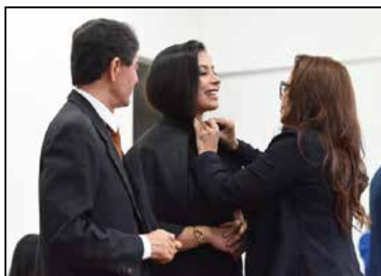
IMAGEM: reprodução do arquivo da Coordenação de Direito – Cerimônia da Capa 2025.2.