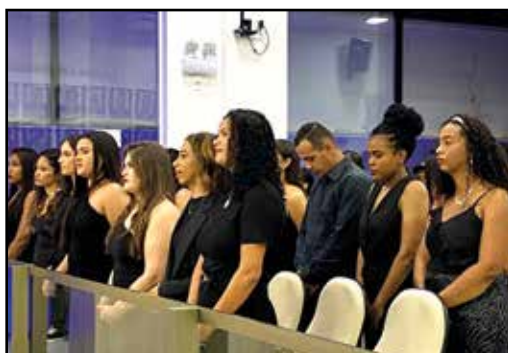
Cerimônia da Beca 2024.2.