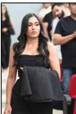
IMAGEM: reprodução do arquivo da Coordenação de Direito – Cerimônia da Capa 2025.2.